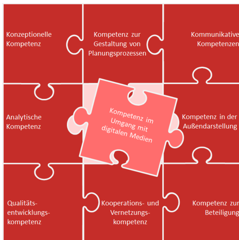
Abbildung 1: Kernkompetenzen einer Planungsfachkraft in der Jugendhilfeplanung, eigene Darstellung

Die Aufgaben einer Planungsfachkraft erfordern ein hohes Maß an fachlichen und administrativen Kenntnissen, sowie ein hohes Maß an methodischen und kommunikativen Fähigkeiten. Im Einzelnen lassen sich hier folgende Kernkompetenzen für eine Planungsfachkraft zusammenfassen: