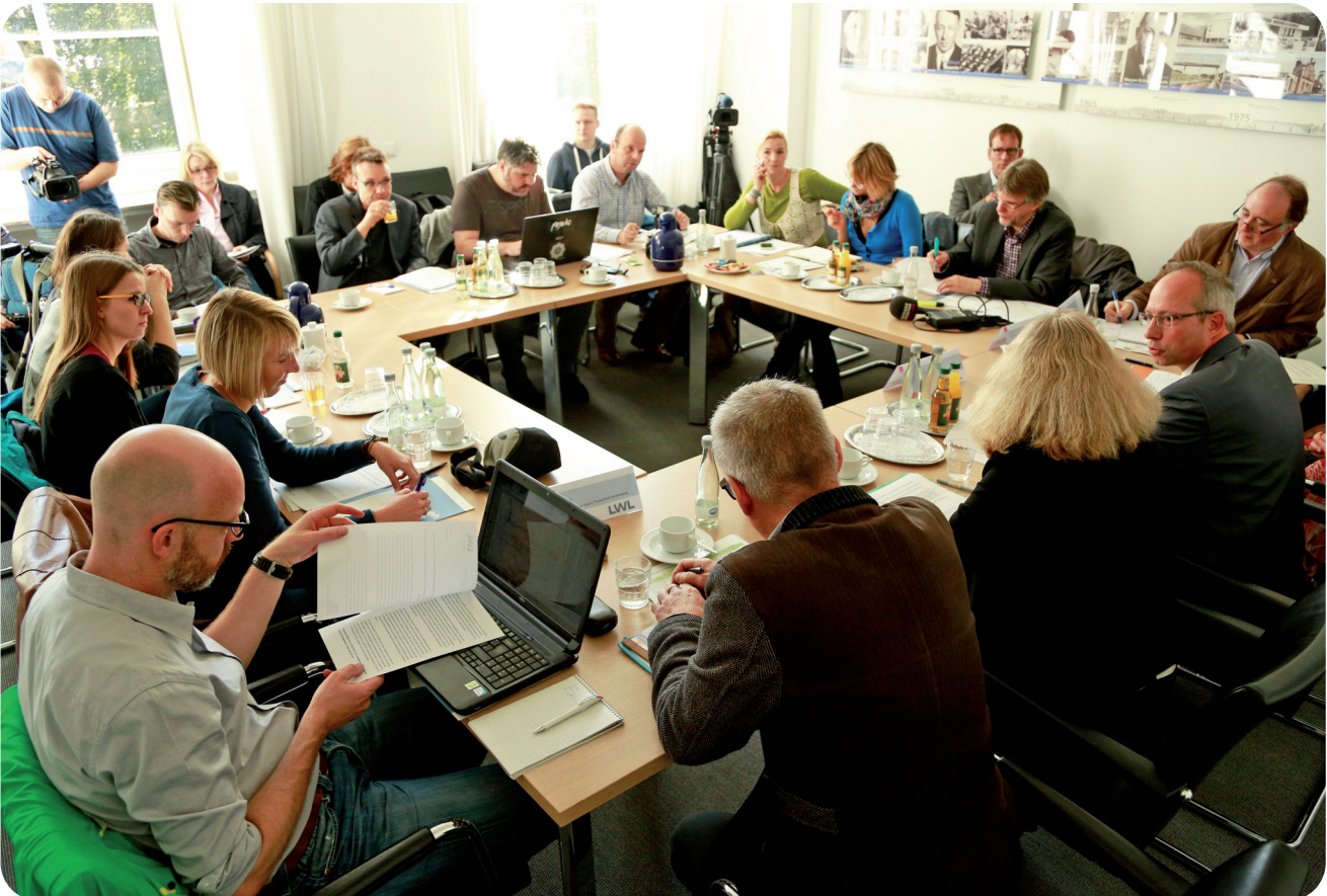
Journalisten in einer Pressekonferenz.

Der Krisenplan nimmt Ihnen im Krisenfall wichtige organisatorische Überlegungen ab und reduziert dadurch