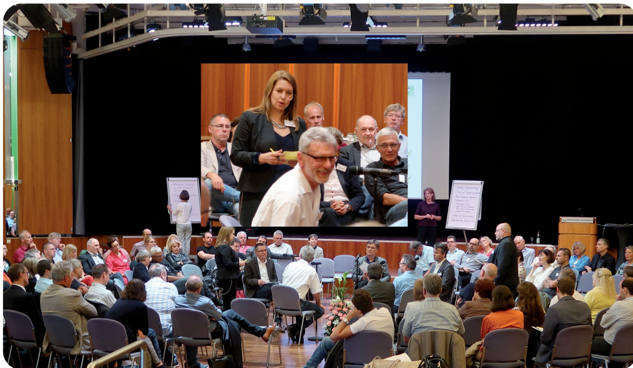
Fishbowl-Diskussion mit den Teilnehmern der Gesamtbayerischen Jugendamtsleitungstagung am 23. April 2018 im Kongresshaus Rosengarten, Coburg.

Nach dem theoretischen und praktischen Input zum Thema Migration begaben sich die Teilnehmer am späteren Nachmittag in den „Fishbowl“. Mit dieser Diskussionsmethode für große Gruppen wurde das Thema „Sind die Instrumente und Standards der Kinder- und Jugendhilfe auch für Migrantenfamilien ausreichend?“ ausführlich erörtert und besprochen. Im inneren Kreis fanden sich engagierte Diskutanten, die sich lebhaft einbrachten und immer wieder neue Teilnehmer in den Innenkreis zogen. Nach einer angeregten und durchaus kritischen Debatte kam man am Schluss aber zu dem übereinstimmenden Ergebnis: Ja, die Kinder- und Jugendhilfe hat genügend Instrumente, um auf die Bedarfe der Migrantenfamilien einzugehen. Und ja, es braucht eine gewisse Sensibilität. Aber, auch darüber war man sich einig: Es liege schließlich im Wesen der Sozialpädagogik, sich immer wieder kreativ auf neue, unbekannte Wege zu begeben.