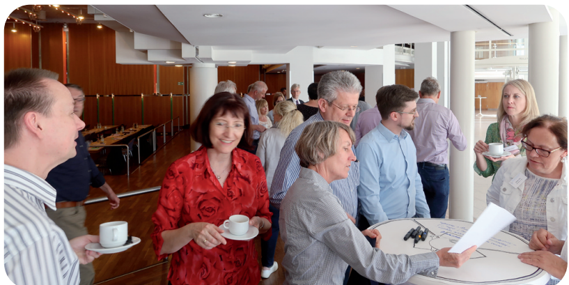
Teilnehmerinnen und Teilnehmer im Worldcafé.

Nach der Mittagspause wurden die Teilnehmerinnen und Teilnehmer ins „Worldcafé“ gebeten. Dort diskutierten sie in den nach Bezirken eingeteilten Gruppen u. a. die Angebote der Hilfen zur Erziehung im Hinblick auf die Digitalisierung, die Beteiligung, die Kinderrechte, die Stärkung der Jugend als Generation und die Bildungsübergänge. In einem zweiten Block wurde auf Grundlage der „Sinuswelten“ diskutiert, wie man die Jugendlichen in ihren Lebenswelten erreicht.